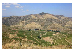
Fig. 70 Quinta de Ervamoira presente na paisagem do Vale do Côa, pág.110

Autor: Sofia Rodrigues Data: 25.07.2014 Localização: Quinta de Ervamoira