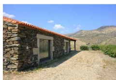
Fig. 69 Vista lateral da Quinta de Ervamoira, pág. 110

Autor: Sofia Rodrigues Data: 25.07.2014 Localização: Museu do Côa