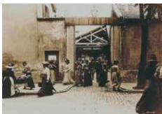
Fig. 74 Cena do filme "La Sortie de l'usine Lumière à Lyon", pág. 120

Autor: Sofia Rodrigues Data: 25.07.2014 Local: Museu do Côa