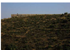
Fig. 73 Museu do Côa presente na paisagem do Vale do Côa, pág.112

Autor: Arq. Camilo Rebelo e Tiago Pimentel Data: 18.08.2014