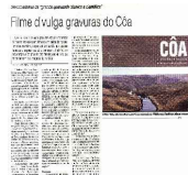
Fig. 63 Artigo "Filme divulga gravuras do Côa", Jornal Nova Guarda, 21.11.2007, pág. 98

Autor: desconhecido Data: 03.09.2014 Localização: www.museuarqueologia.pt