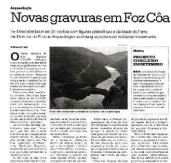
Fig. 62 Artigo "Novas Gravuras em Foz Côa", Jornal de Notícias, 05.03.2005, pág. 98

Autor: desconhecido Data: 03.09.2014 Localização: www.museuarqueologia.pt