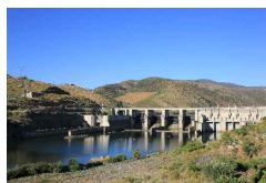
Fig. 66 Barragem do Pocinho, pág. 105

Data: 25.07.2014 Localização: Parque Arqueológico Vale do Côa