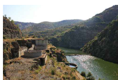
Fig. 67 Central Eléctrica da Barragem de Foz Côa, pág. 107

Autor: Sofia Rodrigues Data: 21.07.2014 Localização: Barragem do Pocinho