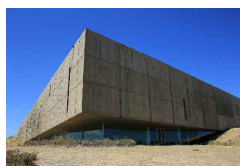
Fig. 68 Museu do Côa, pág. 109

Autor: Sofia Rodrigues Data: 27.07.2014 Localização: Barragem de Foz Côa