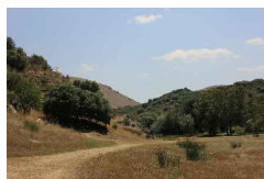
Fig. 65 Penascosa, núcleo presente no Parque Arqueológico do Vale do Côa, pág. 101

Autor: desconhecido Data: 03.09.2014 Localização: www.museuarqueologia.pt