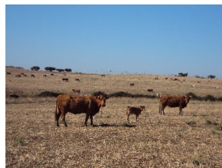
Gado a pastar