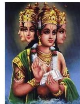
Rhama , 7ª encarnação de Vishnu , muito virtuoso, esposo e soberano ideal.