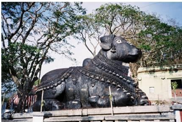
O boi Nandi , no monte Chamundi em Mysore .