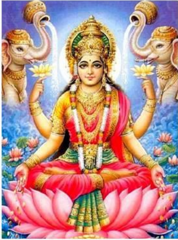
Lakshmi , esposa de Vishnu , deusa da riqueza e felicidade.