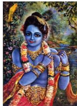
Krishna , 8ª encarnação de Vishnu , em forma de criança ou jovem com uma flauta.

Skanda , deus guerreiro, filho de Shiva . Montado num pavão e equipado com o arco na mão e flechas nas costas, partiu em combate, matando Taraka e outros demônios.