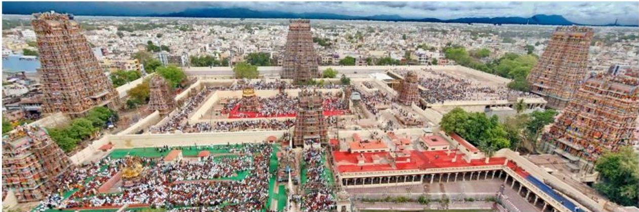
Vista aérea do complexo do Templo de Meenakshi Amman .