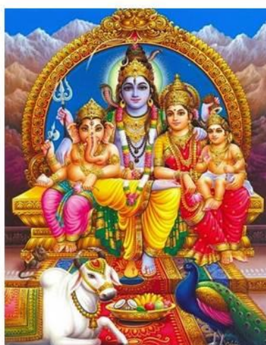
Shiva, Parvati, Skanda e Ganesh.