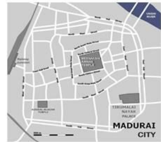
Localização do Templo Meenakshi em Madurai .

→ Planeamento da cidade: em quadrado, com ruas concêntricas, tendo por centro o templo onde “as ruas passaram a ser irradiadas como lótus e suas pétalas”.