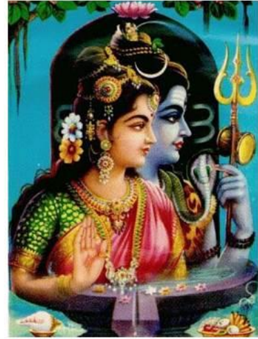
Parvati , "filha das montanhas" (Himalaias), esposa meiga e bondosa de Shiva .