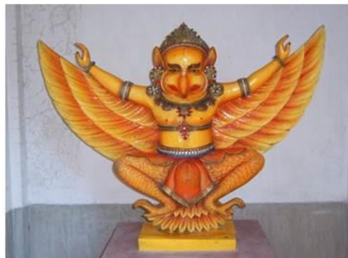
Representação de Garuda , em Begala Ocidental.