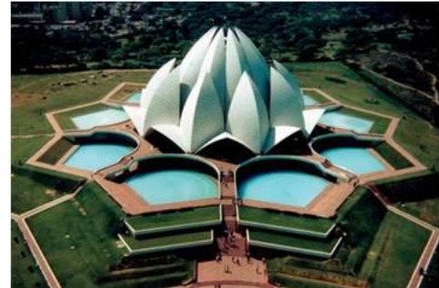
Templo de Lótus, casa de adoração Bahai em Nova Delhi.

A religião de Sri Sathya Sai Baba é a essência de toda fé e toda religião, incluindo aquelas como o islamismo, o cristianismo e o judaísmo.