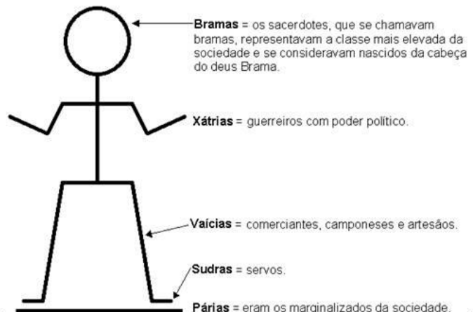
Sistema de castas da Índia.