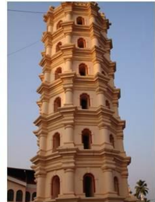
Templo de Shri Manguesh (1565), em Pondá, um dos santuários mais conhecidos de Goa.