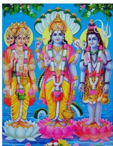
Brahma, Vishnu e Shiva.