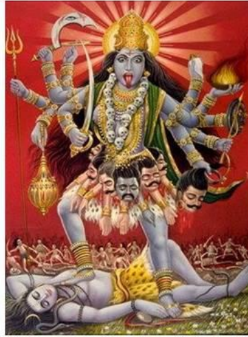
Kali ou Durga violenta esposa de Shiva , carrasco dos demônios.