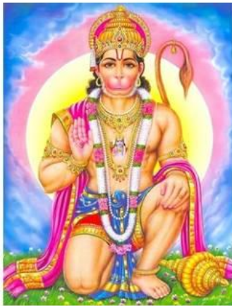
Hanuman , deus-macaco, esperto e imortal, ajudou Rhama quando este desafiou o príncipe dos demônios. Patrono dos soldados.

Yama , 1º mortal e senhor dos mortos, montado num búfalo.