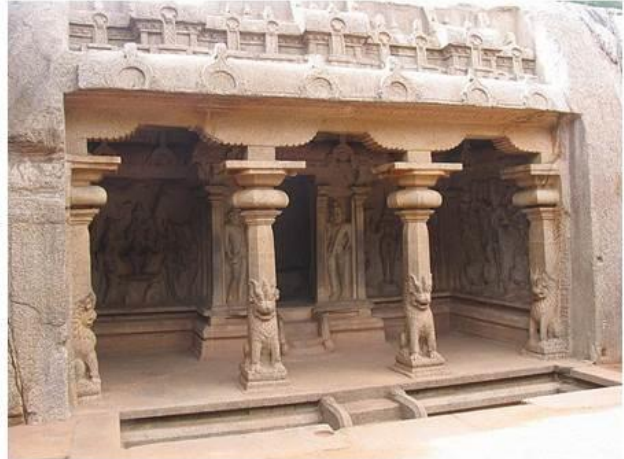
Templo escavado de Trimurti em Arjuna , na região de Tamil Nadu , dedicado aos deuses Shiva , Vishnu e Skanda . No pórtico da entrada encontram-se colunas com figuras-guardiãs.