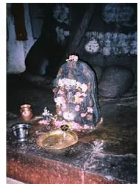
Pequeno templo dedicado ao touro Nandi em Bangalore . É a montaria e servo mais fiel de Shiva . Encontra-se deitado, guardando os portões principais dos templos dedicados a Shiva .