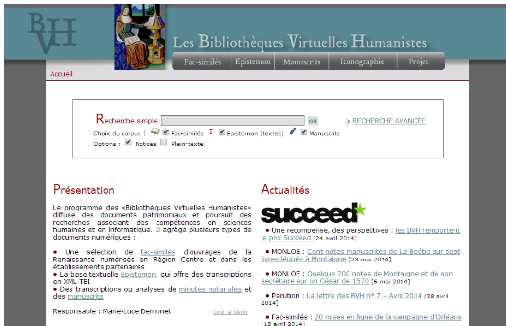
Figura 3 Bibliothèques Virtuelles Humanistes - página de acolhimento

Disponibiliza a informação em quatro secções; o Fac-simile, o Epistemon, manuscritos e iconografia.