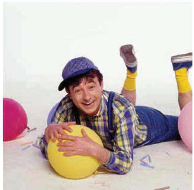
Revista à Portuguesa “Isto só Visto!”