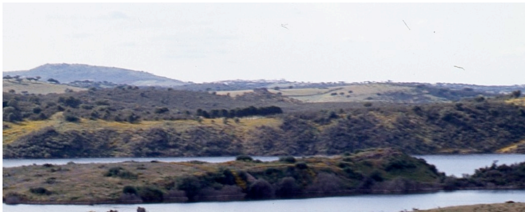
2 – Restos dos castelo Cuncos quase submerso – entre o Guadiana e a ribeira de Cuncos, vendo-se a zona de Monsaraz ao fundo (foto feita a partir da zona norte do território de Mourão (Cuncos encontra-se actualmente sob as águas da barragem de Alqueva)