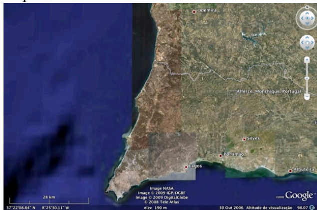
Figura 3 – Zona de Alferce (serra de Monchique).