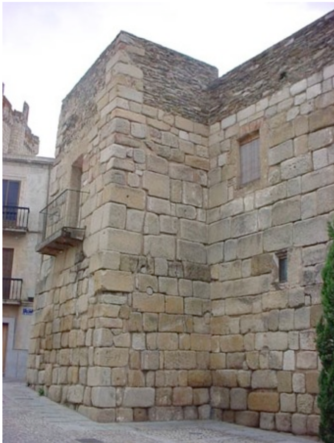
Figura 5 – Coria. Localidade onde se fixou o filho de Sulaymna ibn Martin, após a derrota de Mahmud