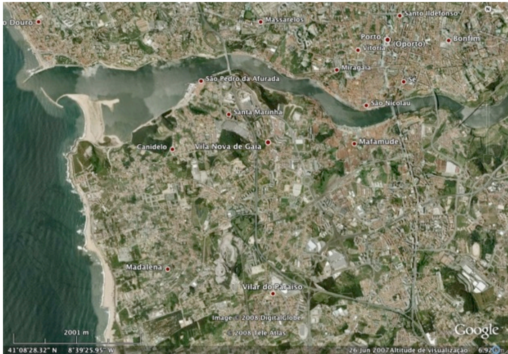
Figura 4 - Mafamude e sua envolvente na actualidade.