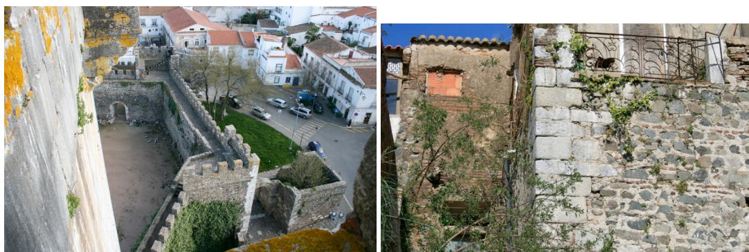
fig. 41 - zona do Castelo-possível zona da qasaba de época califal