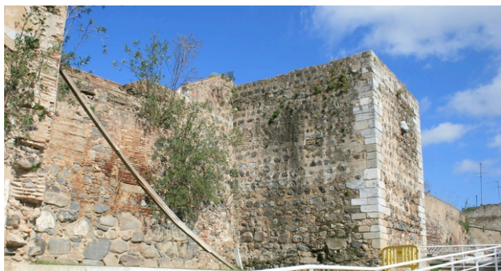
fig. 40 - torre com mortivo apotropaico (cabeça de touro) na muralha de Beja, em zona onde se encontram vestígios de materiais romanos e tardo-romanos reutilizados.