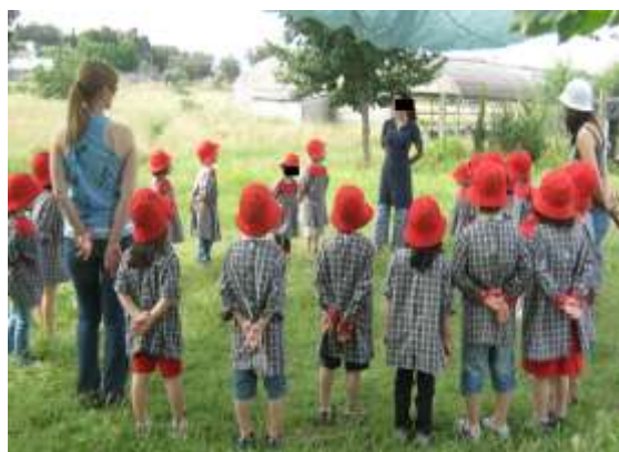
Anexo 32 - Dança do Caranguejo.