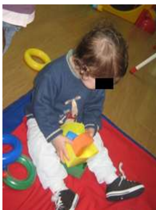
Anexo 27 - Exploração de Materiais de Encaixe.