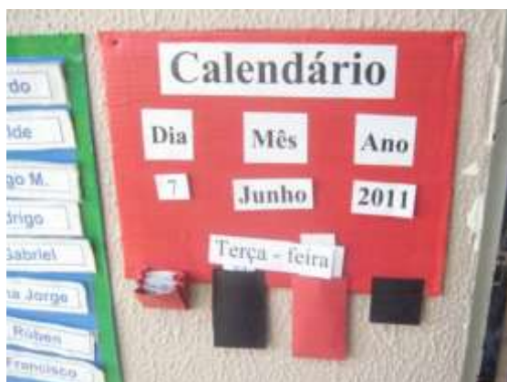
Anexo 39 - Exploração do Calendário.