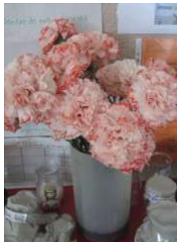
Anexo 42 - Experiência com corante vermelho.