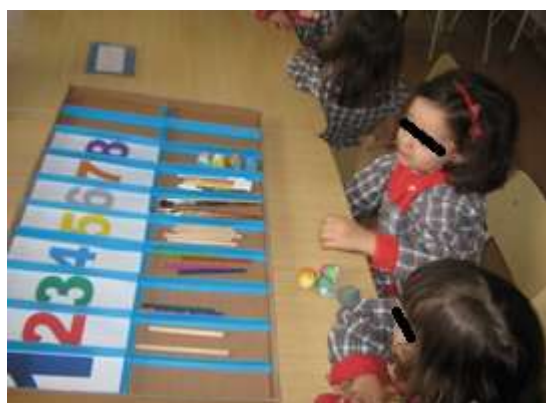
Anexo 38 - Coleções Testemunho.