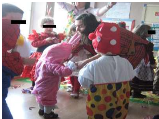
Anexo 18 - Interação com as três salas, Baile de Máscaras.