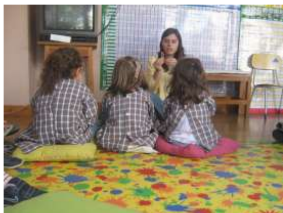
Anexo 34 - Contar a histórias As Cinco Vogais.