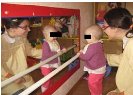
Anexo 16 - Descoberta do espelho.