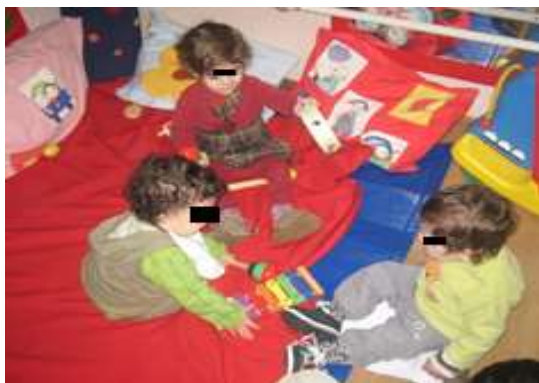
Anexo 25 - Exploração de instrumentos musicais.