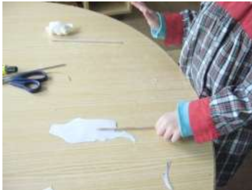
Anexo 59 - Execução dos fantoches.