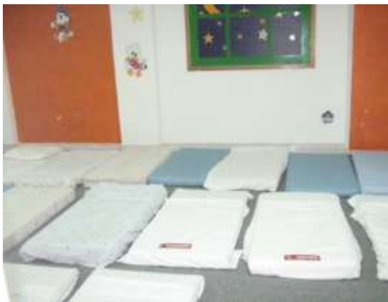
Anexo 4 – Dormitório de J.I.