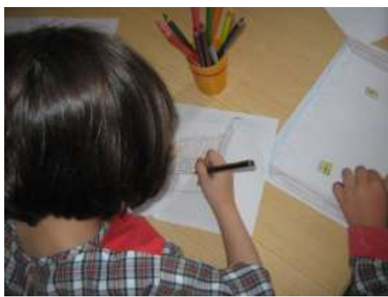
Anexo 51 - Ilustrações sobre castelos.