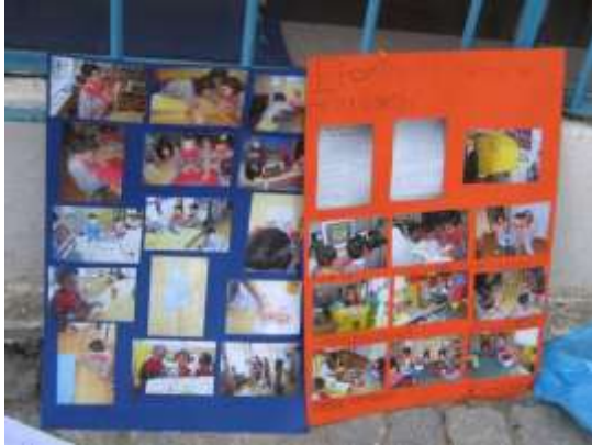
Anexo 62 - Cartolinas para a socialização.