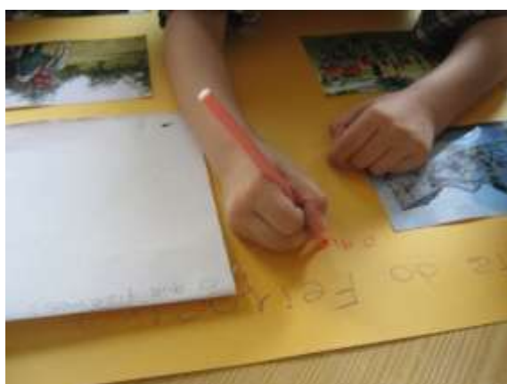
Anexo 36 - Desenvolvimento da escrita - registo da visita.