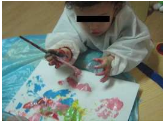
Anexo 14 - Reação à mão pintada.