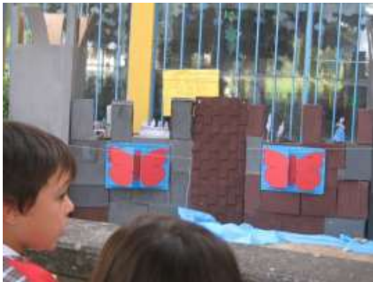
Anexo 63 - Castelo das Borboletas.