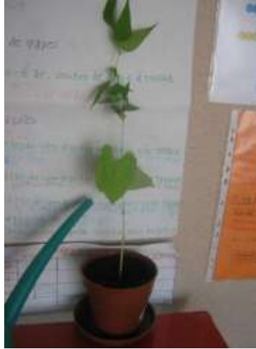
Anexo 41 - Importância das plantas e de as regar.