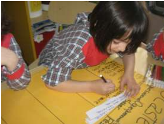
Anexo 47 - Planificação do Projecto.