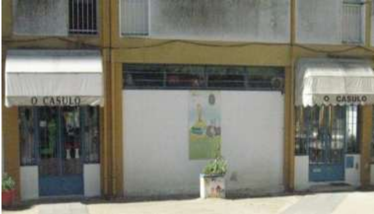
Anexo 2 – Entrada da Instituição.