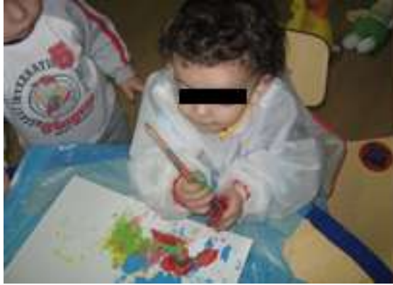
Anexo 13 - Criança pintou a mão durante a Pintura com Pincel.