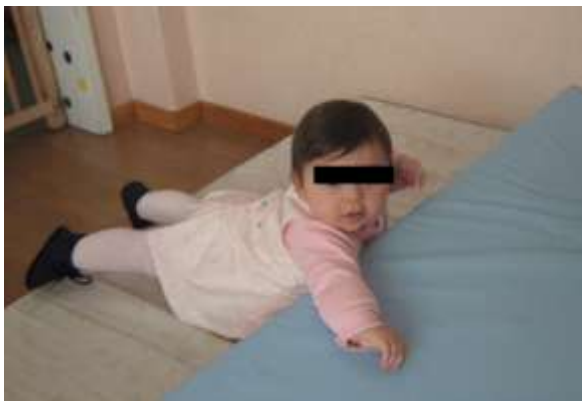
Anexo 7 - Estimulação Motora.