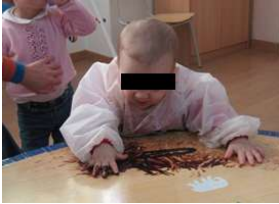
Anexo 21 – Digitinta.