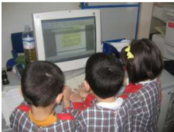
Anexo 49 – Pesquisas.