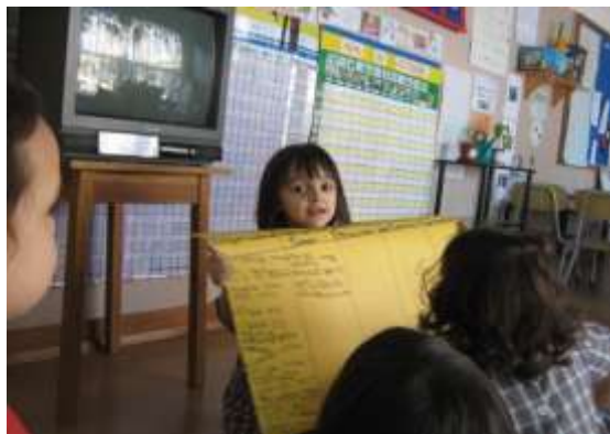
Anexo 48 - Comunicação sobre o Projecto.