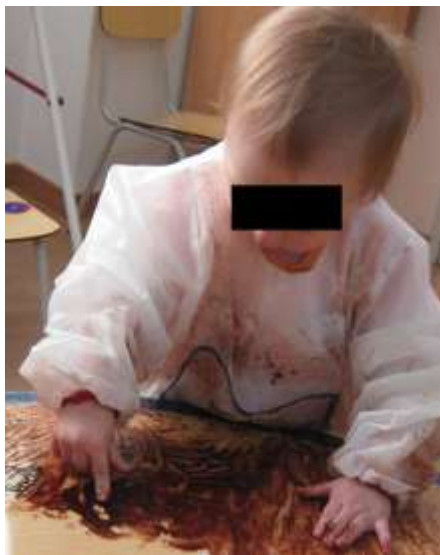
Anexo 23 - Formas circulares.