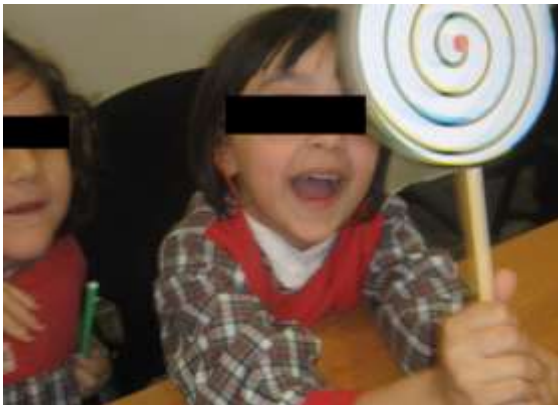
Anexo 31 - Contacto com a arte.