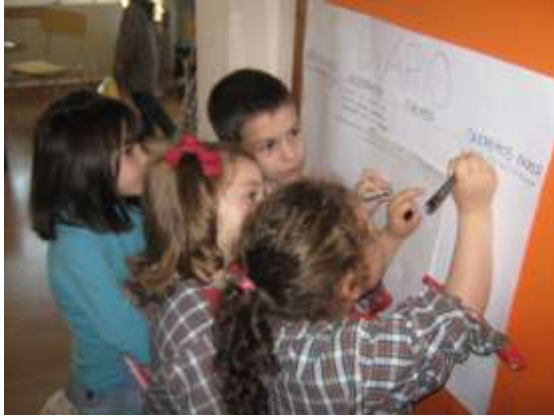
Anexo 45 - Diário de Turma.