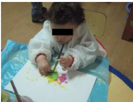
Anexo 11 - Pintura com o Pincel e os dedos.