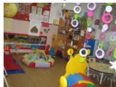
Vista Geral da sala