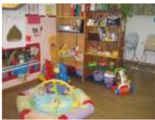
Área de actividades