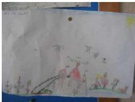
Anexo 52 - Castelo das Borboletas.