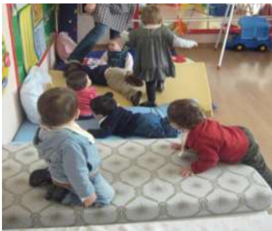
Anexo 9 - Expressão Motora.