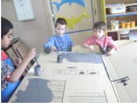
Anexo 57 - Pintura das torres.