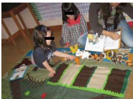
Anexo 35 - História contada com um tapete, interacção com a mãe de uma criança.