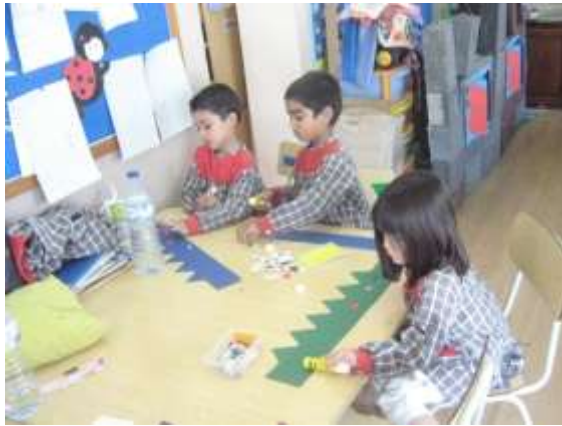
Anexo 58 - Construção das coroas.