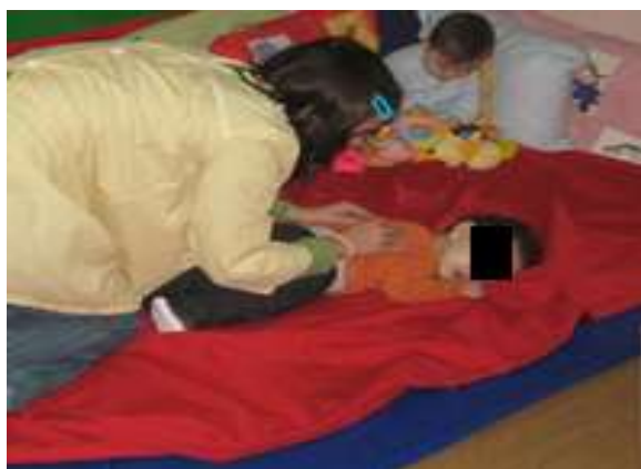
Anexo 19 – Massagens.