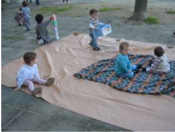
Anexo 29 - Saída para o espaço exterior.