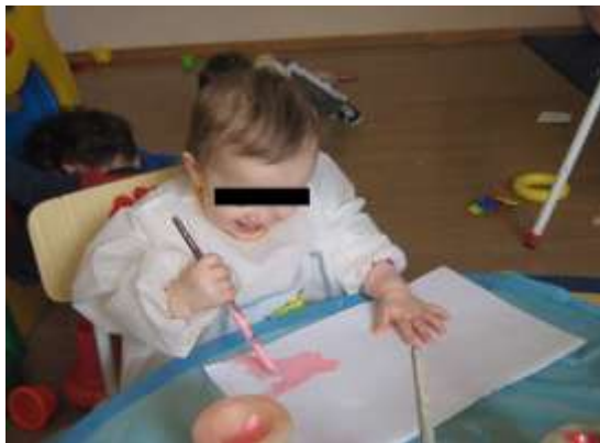
Anexo 15 - Impacto positivo quando ocorreu o contacto com o pincel.