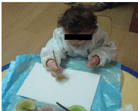
Anexo 10 - Pintura com Pincel.