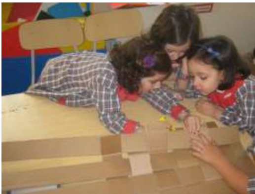
Anexo 55 - Entrelaçar as tiras de cartão.