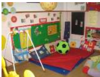
Área das almofadas