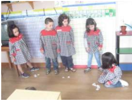
Anexo 46 - Votação chefe de sala.