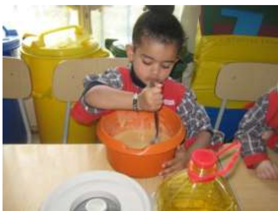
Anexo 40 - Execução de um bolo (Culinária).