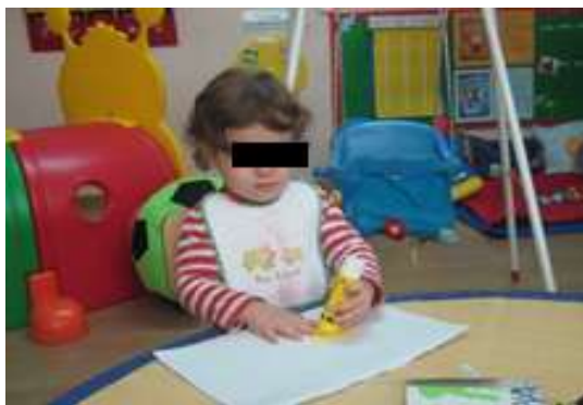
Anexo 24 – Colagem.