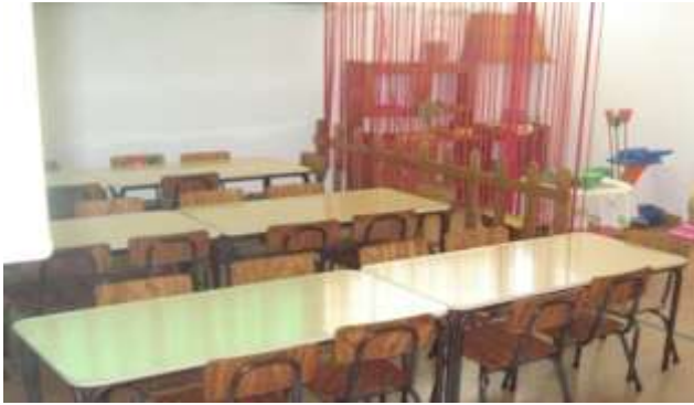
Anexo 5 – Refeitório.