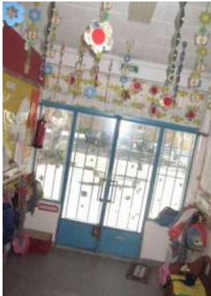
Anexo 3 - Átrio de Acolhimento.