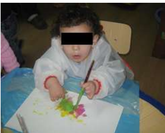
Anexo 12 - A reacção da criança.