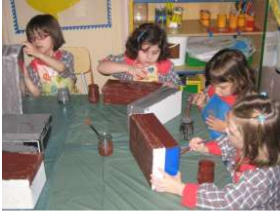
Anexo 53 - Pintura das caixas de sapatos.