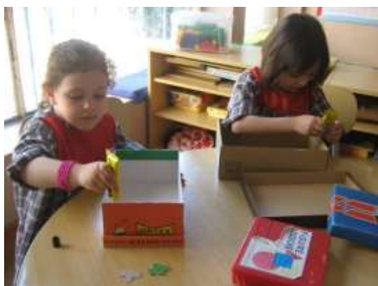
Anexo 50 - Colagem das caixas.