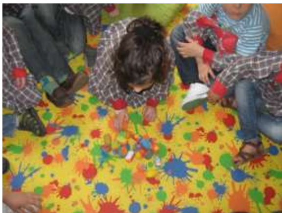
Anexo 37 - Exploração de ovos da Páscoa – exploração a matemática.