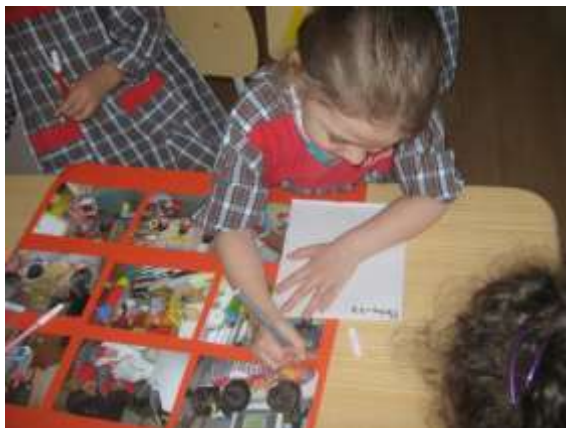
Anexo 60 - Elaboração da cartolina para a socialização.