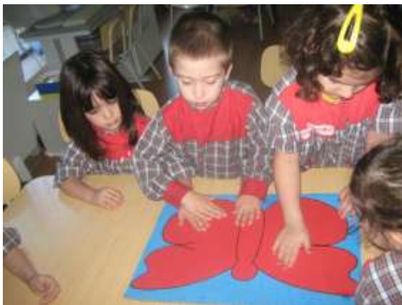
Anexo 56 - Construção das janelas.