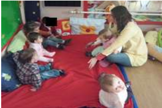
Anexo 30 - Interação com o grupo.