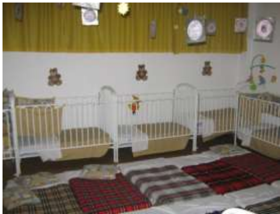
Anexo 6 – Dormitório de Creche.