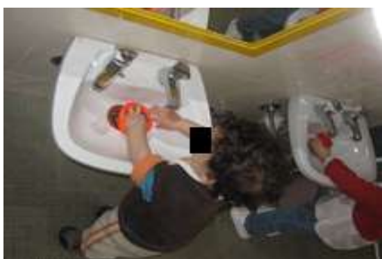
Anexo 28 - Exploração da Água.