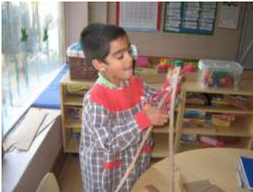
Anexo 54 - Recorte das tiras.