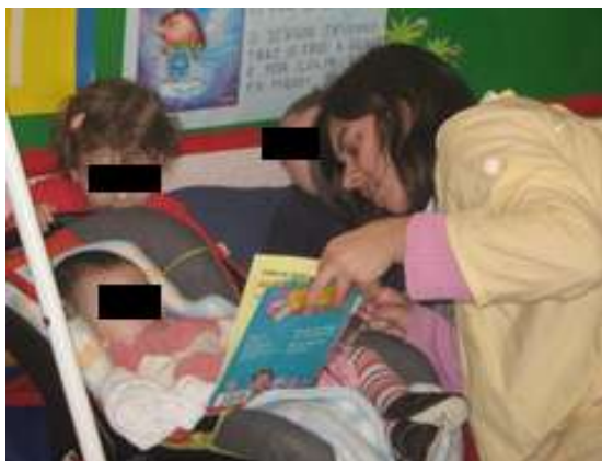
Anexo 26 - Exploração individualizada para as crianças mais novas.