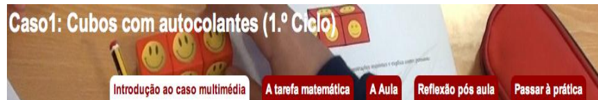
Figura 1: A estrutura do caso multimédia, organizado em cinco secções

finalizando-se com uma proposta de reflexão sobre a aula e um convite para passar à prática (cf. Figura 1).