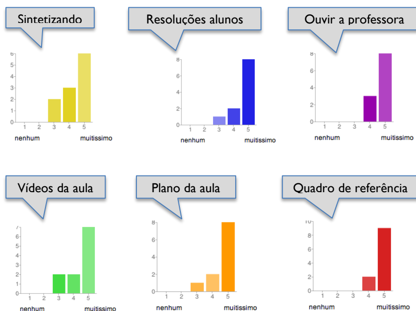
Figura 4: Gráficos relativos ao questionário respondido pelas alunas

Estes gráficos revelam a apreciação positiva que as alunas fizeram do facto de terem diversos materiais à disposição, tendo, em todos os casos, a maioria das respostas recaído no nível mais elevado de interesse.